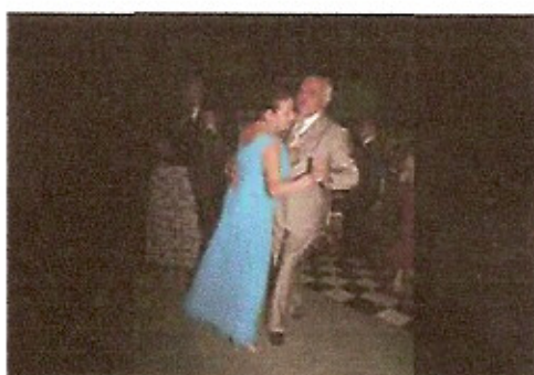
Casal Governador dançando a valsa