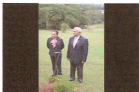
Plantio da árvore da amizade