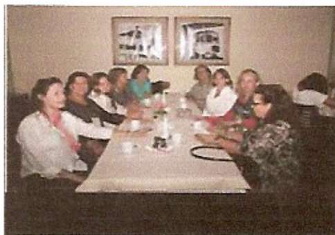
Concorrido Chá dos Cônjuges