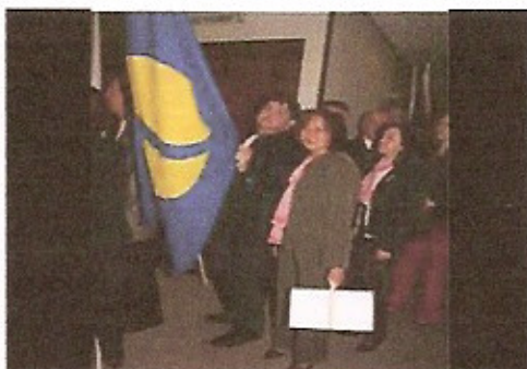
Entrada das Bandeiras