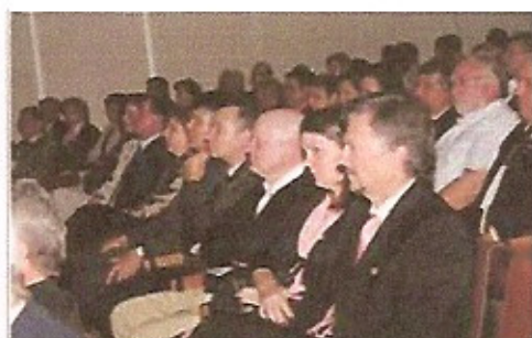
Platéia na seção Solene de abertura da XIII Conferência Distrital