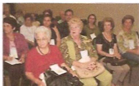
Vista geral da platéia participante