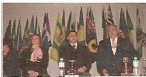
Abertura Solene da Conferência