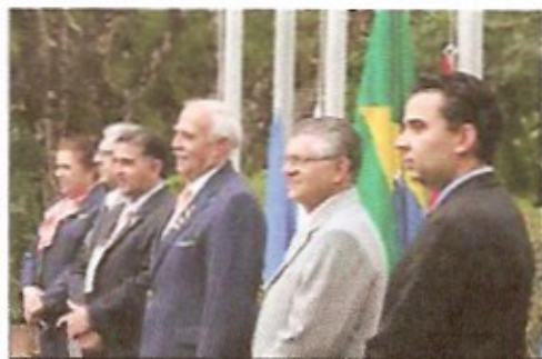
Cerimônia de hasteamento das bandeiras