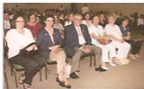
Vista geral da platéia participante