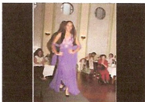
Desfile de Modas durante o Chá pela Boutique Dalu