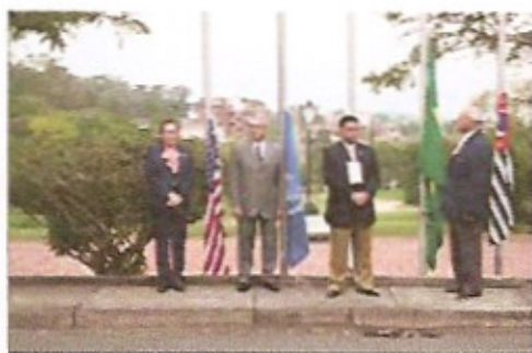
Cerimônia de hasteamento das bandeiras