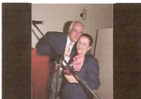
Governador homenageia sua esposa