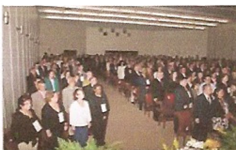
Platéia na seção Solene de abertura da XIII Conferência Distrital