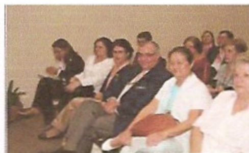
Vista geral da platéia participante