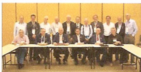
Reunião do Colégio de Governadores do Distrito 4310

«O Sucesso frequentemente está apenas a uma idéia de distância» frank tage