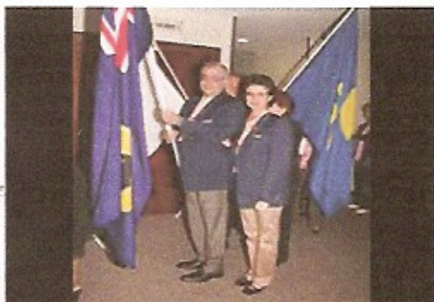
Entrada das Bandeiras