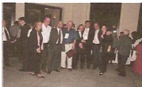
Grupo de Companheiros do RC de Botucatu no Coquetel de companheirismo