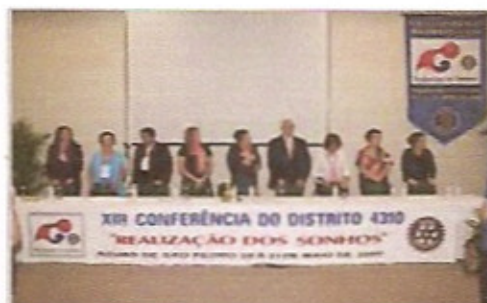
Seção solene de abertura das atividades dos cônjuges