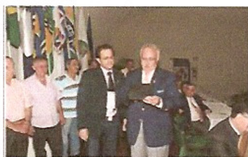
O Governador é homenageado pelo seus companheiros de Clube