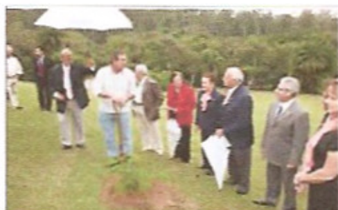
Plantio da árvore da amizade