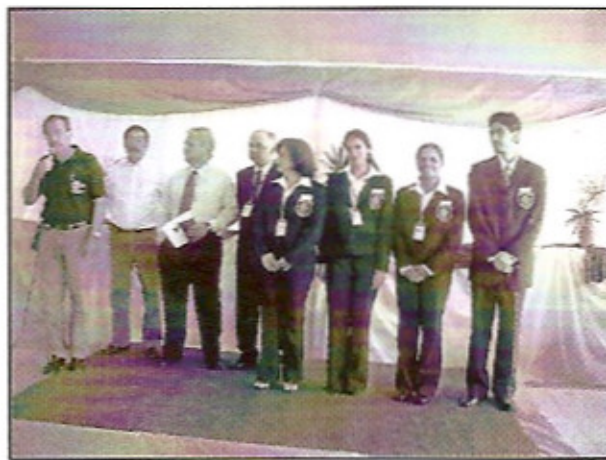
Grupo do IGE que embarcou para a França na apresentação para as esposas no I EMD 4310