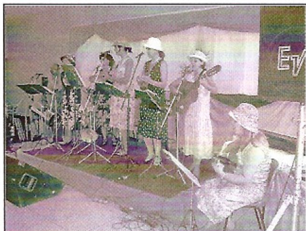
As mulheres do conjunto musical Essência Feminina encantaram o I EMD 4310