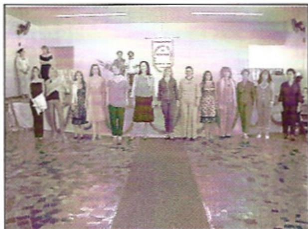
Esposas mancquins que desfilaram durante o I EMD 4310