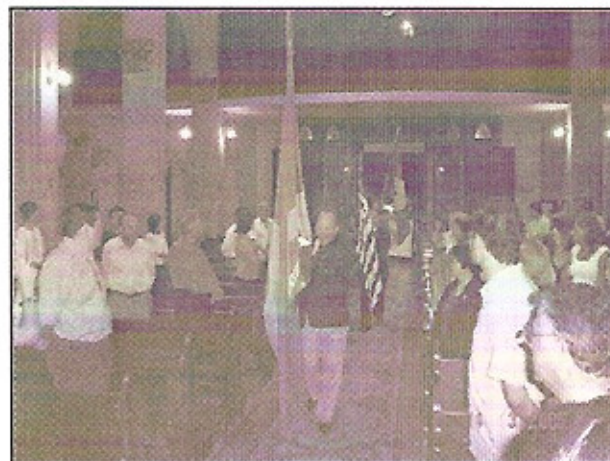
Os Rotary Clubs de Botucatu na Celebração do Centenário