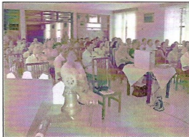
Vista geral do PETS 2005-06 em Igarapu do Tietê