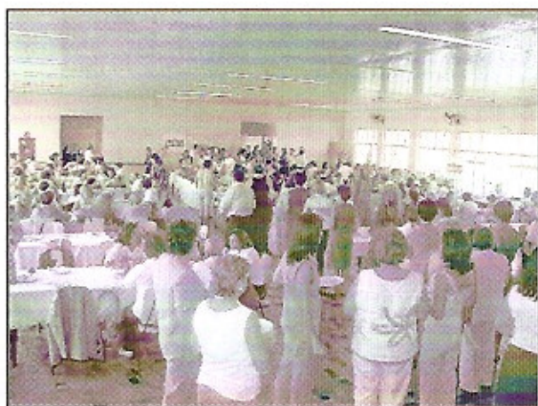
Flagrante do almoço no I EMD 4310