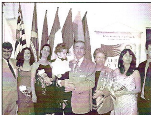
Família Rotária se fazendo presente à reunião festiva da visita oficial aos Rotary Clubs de Sumaré, Sumaré-Ação e Sumaré-Norte