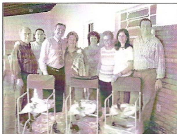
Entrega de cadeiras de banho ao Recanto dos Velhinhos pelo Rotary Club de Macatuba durante a visita do governador com sua esposa