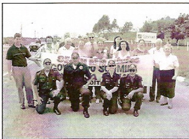
O Rotary Club de Boituva recepcionou o casal governador na entrada da cidade com direito a faixa, rojões e batedores da Polícia Civil que conduziram a caravana de companheiros pela cidade