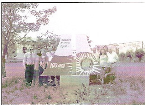
Na entrada de Boituva o casal governador com a comitiva de companheiros posam junto ao Marco Rotário, remodelado em comemoração ao Centenário de Rotary International.