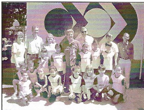
As crianças do projeto Geração Futuro do RC de Indaiatuba-Votura com o casal governador no Colégio Objetivo, onde estudam graciosamente