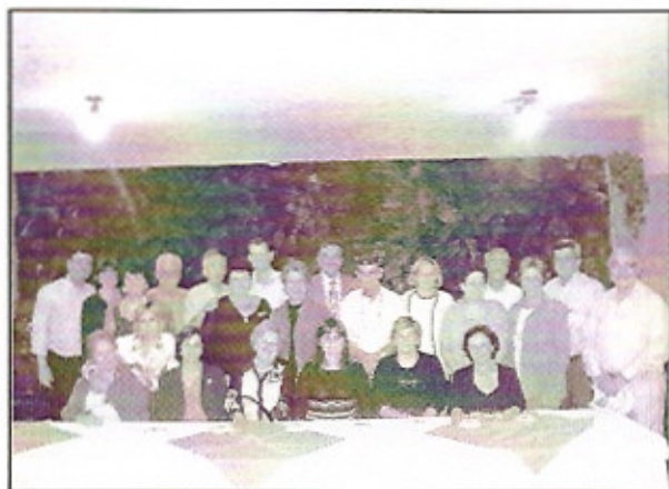
Companheiros e companheiras do RC de Piracicaba-Luiz de Queiroz, posam para uma foto com o casal governador logo após a Assembléia da visita oficial